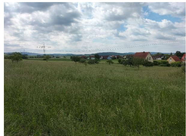
Abb.: Ansichten von Norden

Der nordwestliche Teil der Baufläche ist eine locker mit jüngeren Obstgehölzen bestandene artenreiche Mähwiese (u.a. Wiesenschwingel, Wiesenrispengras, Wiesenlabkraut, Gem. Hornklee, Vogelwicke, Behaarte Wicke, Zottige Wicke, Gem. Reiherschnabel, Wiesenklee, Ackerklee, Margerite, Echte Kamille, Kleiner Klee, Ackerwinde, gem. Hahnenfuß, Gänsedistel, Schafgarbe, Knollen-Platterbse)