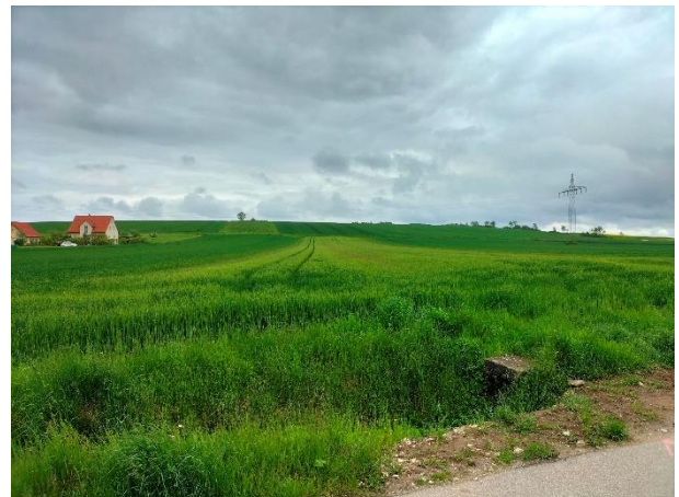
Abb.: Ansichten von Süden