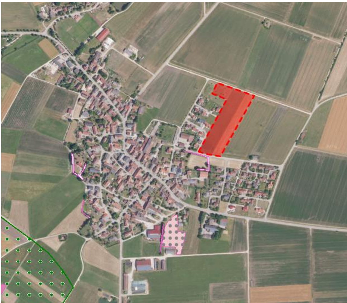
Abb.: Luftbild mit Schutzgebieten (Bayernatlas 2024): Biotop rosa, LSG grün

Die Gemeinde Alesheim plant den Bebauungsplan Alesheim Nr. 7 „Am Echerlein II“ in Alesheim mit einer Größe von ca. 2,25 ha. Die Eingriffsflächen sind intensiv genutzte landwirtschaftliche Flächen (Acker) und artenreiche Wiese mit einzelnen jüngeren Obstgehölzen. Der Straßengraben zum Störzelbacher Weg im Süden ist eutrophiert und dicht bewachsen, ebenso der Straßenrain am Nordende der geplanten Bebauung.. Am Rand der bestehenden Bebauung im Westen stocken einige wenige Gehölze. Südlich des Störzelbacher Weges liegt das Biotop 6931-0051-007 Hecken um Alesheim und Störzelbach . Einträge in der Artenschutzkartierung sind nicht vorhanden.